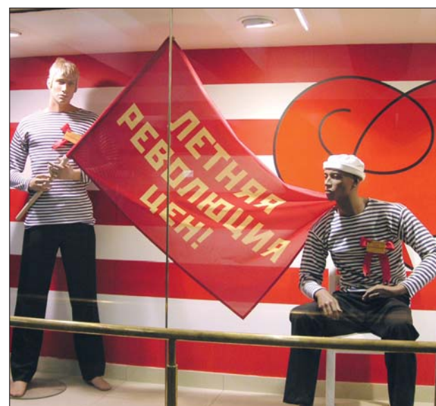
Auch die Werbung setzt auf Patriotismus, indem sie z. B. mit sozialistischer Symbolik spielt. So verspricht diese Schaufensterwerbung eine „Sommerrevolution der Preise“.

So zeigen sich in der aktuellen Krise Risiken, aber auch Chancen. Verlierer sind in jedem Falle die guten deutsch-russischen Beziehungen, die in den letzten fünfzehn Jahren zunehmend durch ökonomische Erfolge für beide Staaten gestützt wurden.