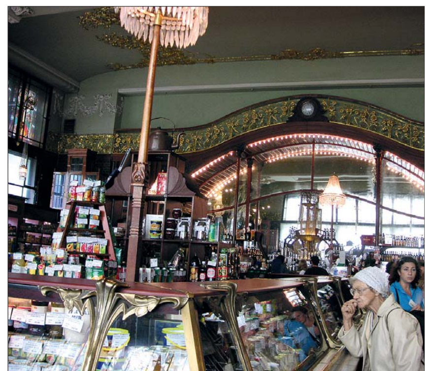
In St. Petersburgs berühmtesten Feinkostgeschäft „Jelissejew“ werden ausgesuchte Delikatessen zu entsprechenden Preisen angeboten, aber auch in ganz normalen Lebensmittelgeschäften werden für die Russen die Auswirkungen von Gegenanktionen (Einfuhrverbot für Lebensmittel aus der EU und der Türkei) und des Rubelverfalls im eigenen Geldbeutel spürbar.

Hinsichtlich der mentalen Reaktion auf bevorstehende Krisen unterscheiden sich die russische und deutsche Mentalität.